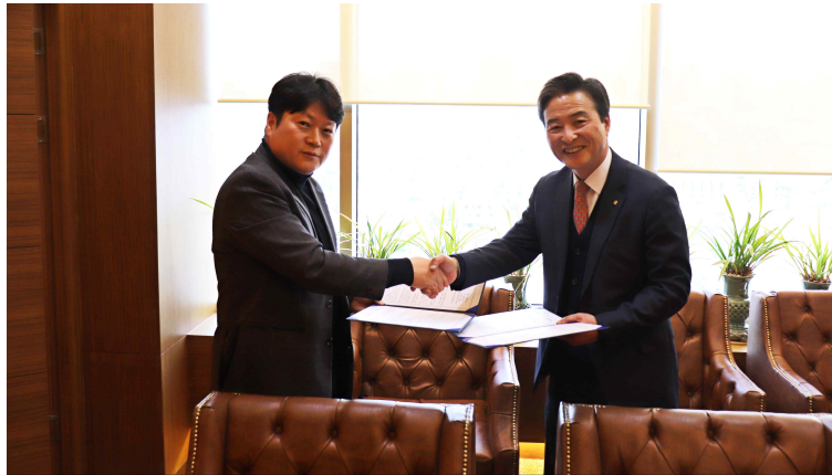
한국FPSB-하늘안과의원 양해각서 체결식